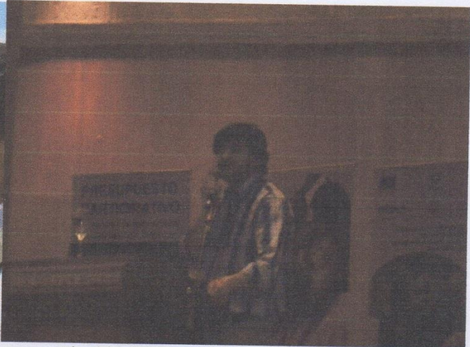
Alcalde de Cotacachi en su exposición