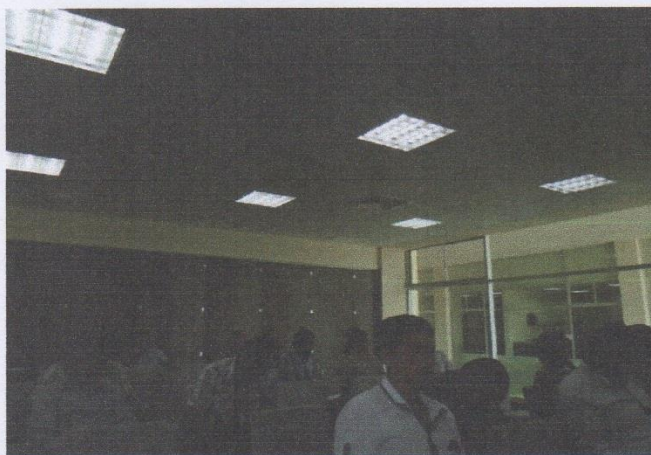
foto de los participantes de lo GADPR

La próxima reunión será el Jueves 08 de octubre del 2015 y con los siguientes Ministerios: Educación, Salud, prevención de desastres (riesgos) y Policía Nacional.