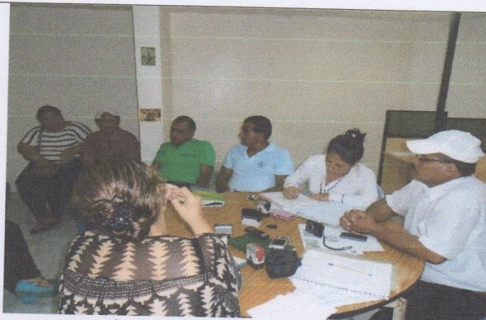
foto en la sesión de junta con presencia de la comisión de la Asociación de comerciantes de orillas del Río San Miguel