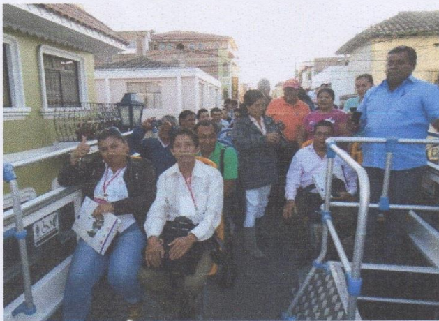
foto recorrido después del taller