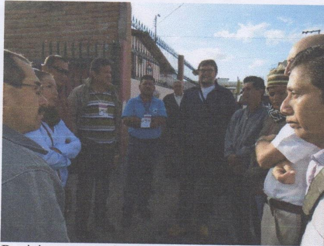
Participantes que fuimos a la feria de productos