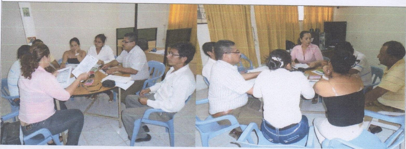
foto en la sesión extraordinaria del 22 de septiembre

En resolución se acuerda realizar este evento de presupuesto participativo este lunes 28 de septiembre del presente año.