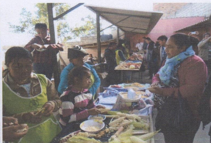
Feria campesina de productos orgánicos

G.A.D. RURAL PARROQUIAL GENERAL FARFAN COMISIÓN DE PLANIFICACIÓN Y PRESUPUESTO