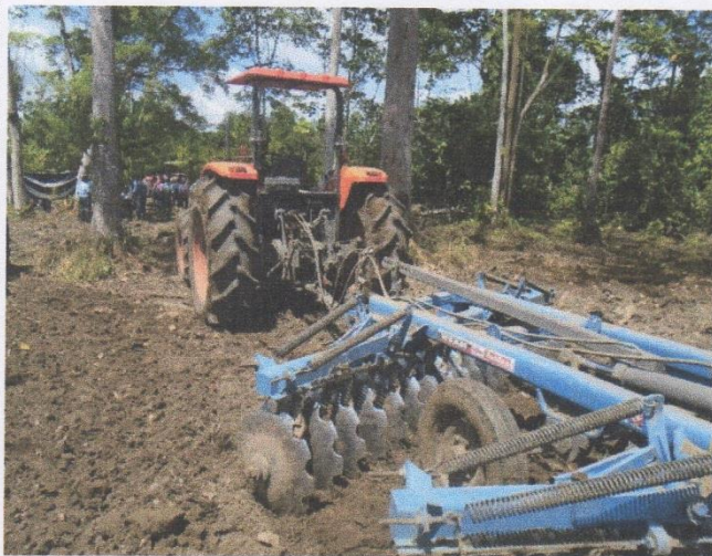
Foto: Maquina para abonar al boleó