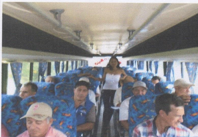
Foto: Recibiendo explicación de los ingenieros