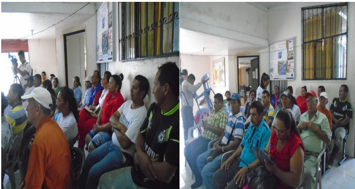
Firmas de la asistencia de la reunión